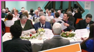
L'Association fête ses 40 ans