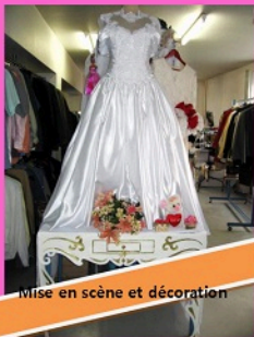
Mise en scène et décoration