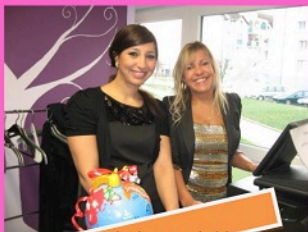
Une journée de vente à thème